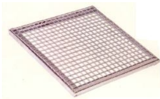
Classe B (125 KN)