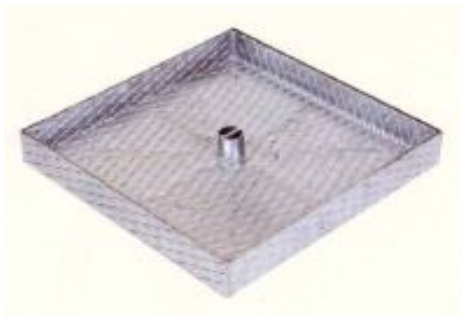
Classe C (250 KN)