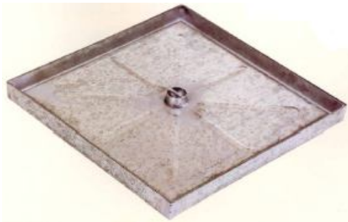
Classe C (250 KN)